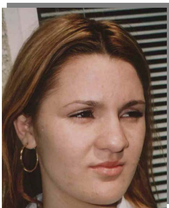
DF după 15 zile de tratament

seboreide de 3 ani. La 15 zile de tratament pustulele sunt absente,