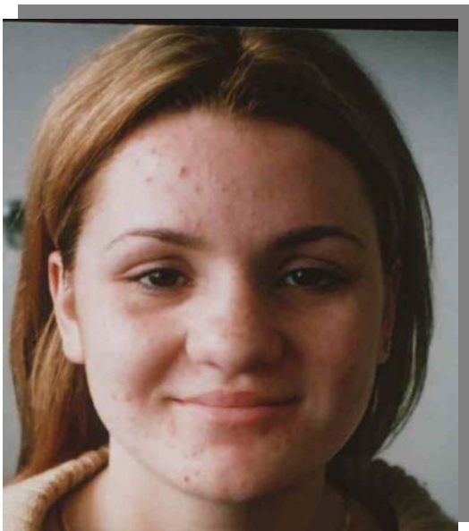
DF la începutul tratamentului - față

comedoanele, eritemul și seboreidele absente, secreția sebacee mult diminuată. Se menține pe regiunea frontală unde sunt și câteva pustule în miniatură. Eritemul, pruritul, veziculația și pigmentația absente. S-a aplicat C Vital în