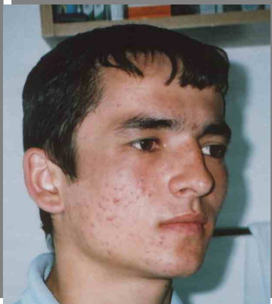
MDD la 30 de zile

facială. S-a evaluat la 30 de zile. Seboreea absentă, comedoane, eritem, pustule absente. Se mențin atrofia, cicatricile, rare pustule de 5 ani. S-a aplicat C Vital, discontinuu, o singură ședință, o fiolă pe ședință și gel AFA 4% la domiciliu la două zile.